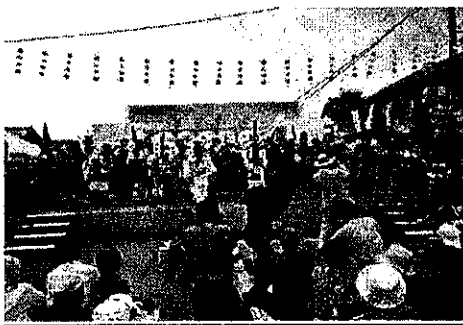
雨天の場合、萩原小学校屋内運動場でコンテスト実施