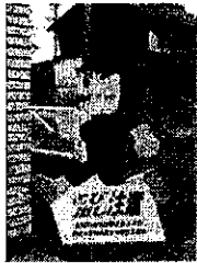
連区内に何体あるんでしょうか?よくみかけますね。