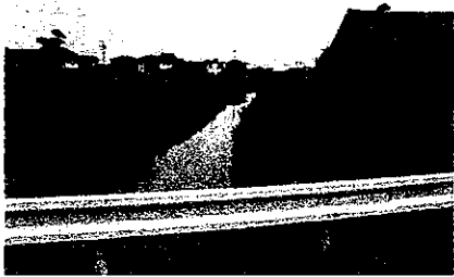
光堂川を渡る美濃路から、中島小のあたりまで、「光」輝くお「堂」があったといえます。(萩原町史より)

稲田はお米だけでなく、たくさんの恵みをもたらししてくれます。夏には稲の根張りを良くする為に、水抜きをして中干しを行います。通称「水落し」と呼ばれ、昔、中島地区では、田んぼと光堂川を行き来するハエ、モロコ、ドジョウ、フナ、コイ、ウナギなどを四つでの網や竹籠で生け捕りしようと、大人から子供まで近郷から大勢の人が集まったといえます。また、化繊の衣類が流通する前は、萩原でも絹糸を紡いでくれたお蚕の桑畑がたくさんあったそうです。いまでも、旧家の屋根裏で藤のお蚕かごをみかけることがあります。(萩原町郷土史研究会)