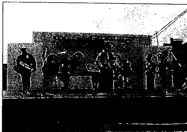
<平成22年度 素人ちんどん大会>