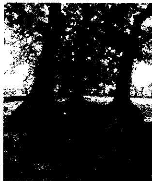
朝宮公園（朝宮字嫁振）手前が夫婦木

萩原町連区地域づくり協議会 10月の活動状況報告 下記の日程で例会等が行われました。