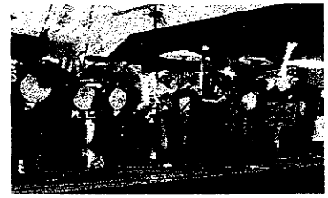
大村知事とチンドン隊

5月27日(日) 抜けるような晴天の中「第46回全国選抜チンドン祭り」が開催されました。