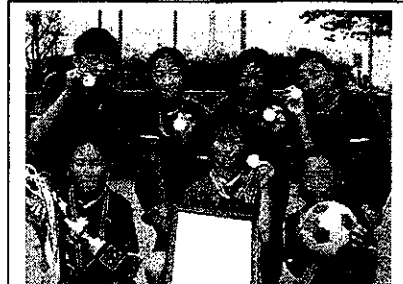
女子の部：優勝の笑顔が美しいほたるA子供会の皆さん