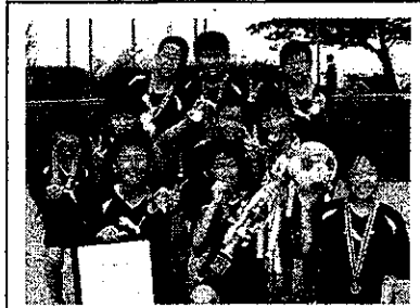
男子の部：優勝の元気いっぱい富田方子供会の皆さん