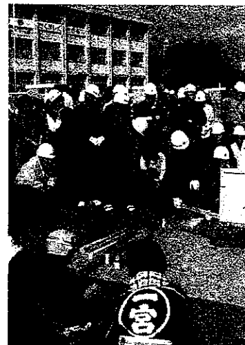
昨年の訓練の一場面

私たち消防団員は、郷土を愛し、水火災等の災害から、町民の生命・身体・財産を守るため消防署員と共に日々訓練に励み、身を挺して防災活動に従事しております。