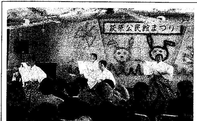
剣舞に会場から大拍手