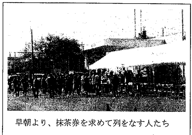
早朝より、抹茶券を求めて列をなす人たち

屋外では、焼きそば・うどん・寿司などを召し上がっていただきました。和室での抹茶は、開店とともに抹茶券はほぼ完売という相変わらずの好評でした。また、ロビーのコーヒーコーナーは、開店から閉店まで満席という状況でした。まさに、食欲の秋でもありました。