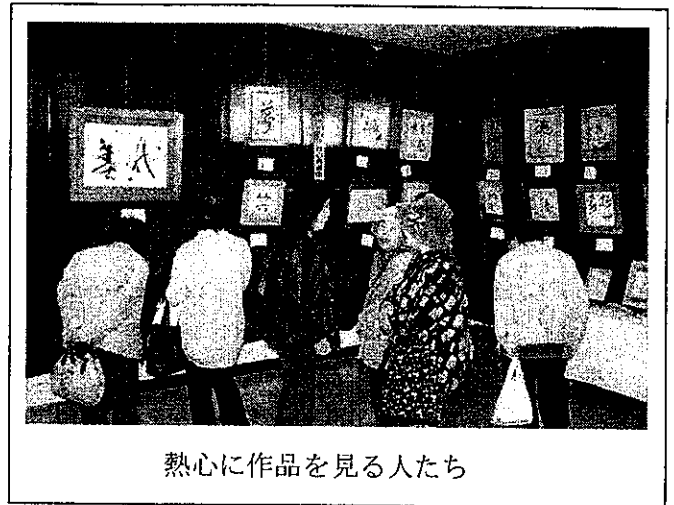
熱心に作品を見る人たち

芸能発表の部では、昨年まで音響機器が古く大変ご迷惑をかけましたが、本年は専門家による音響設営をお願いしたので、すばらしい環境の中で発表をしていただきました。