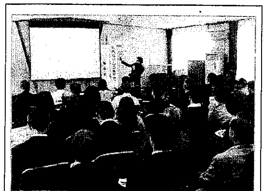
巧みな講師の語りに熱心に聞き入る皆さん

2月23日(土)には、第3回の教育講演会を予定していますので、ぜひお誘い合わせの上ご来場ください。詳しくは、2月号の協議会だよりでお知らせいたします。