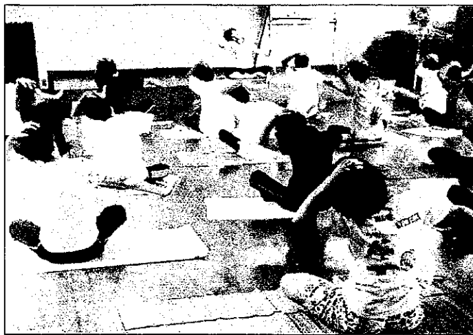
昨年のヨガ教室の様子

萩原町内の女性のみなさま方で、世代を超えたふれあいのひとときを楽しむ会が“萩おとめ”で