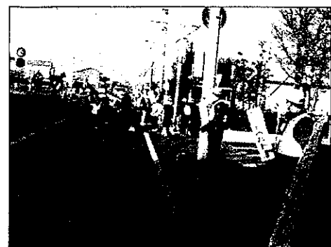
今年1月の通学風景

これからの萩原町を担っていく子どもたちの安全と安心を確保することは、学校にとって最重要課題です。特に、目が届か