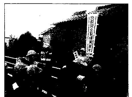
通学児童と見守る地域の方々

ず心配しているのが登下校です。その登下校を見守ってくださる地域や地元企業の方や保護者の方など、多くの方々の思いや活動に対しまして、子どもたちを預かっている学校として感謝の念でいっぱいです。これからも、地域の方々のご支援をいただきながら、安全確保に努めていく所存です。今後の子どもたちの成長を見守っていただけますよう、お願いいたします。