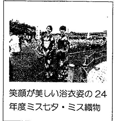
笑顔が美しい浴衣姿の24年度ミスセタ・ミス織物

今年も6月8日(土)・9日(日)の2日間、萬葉公園高松分園で開催します。38種類1,700株以上の色とりどりの花しょうぶを觀賞して、ミスセタ・ミス織物との記念撮影や琴の音を聞きながらのお抹茶を楽しんで頂きたいと思ひます。その他にも色々催しを用意していますので、皆さん、お誘いあわせの上、ぜひお越しください。