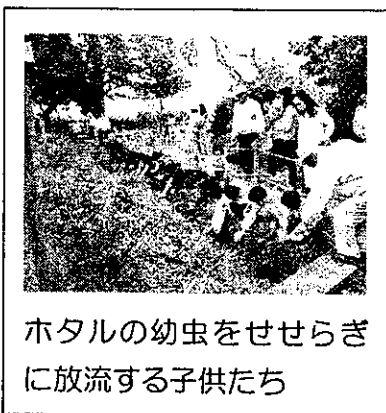
ホタルの幼虫をせせらぎに放流する子供たち

今年もまたホタルが舞う季節がきました。4月の初めに、萩原小学校の有志児童や築込子ども会の皆さんの手で、自然園やせせらぎにホタルの幼虫4,800匹ほど放流しました。5月末ごろから飛び始めますが、見頃は6月上旬から7月上旬の、夜8時~9時ごろの約1ヶ月間です。