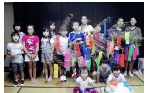
昨年の戸笥子ども会の皆さん

昨年は8本出展して各賞を受賞しました。今年も萩原町の子ども会がたくさん参加しています。●荒南子ども会 ●宮町子ども会 ●滝子ども会 ●中島南方子ども会 ●西御堂子ども会 ●ほたる子ども会 が参加予定です。みなさま、ぜひご観覧ください。