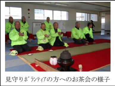
見守りボランティアの方へのお茶会の様子

地域によって差はありますが、通学班の集合場所から通学班と一緒に歩いて連れて来ていただいたり、大きな道路の交差点で児童を渡してもらったりしています。下校では、一人一人の家まで送ってくださる地域もあると聞いています。本年度は万葉児童館が閉鎖され、萩原児童館へ50名以上の児童が通うことになりました。中学校の前の東西の道を横断しますので、危険な場所があります。いろいろな場で協力を呼びかけてきましたが、今年になって4名の方から申し出がありました。大変ありがたいことです。これからも、子どもたちの安全のためよろしくをお願いします。