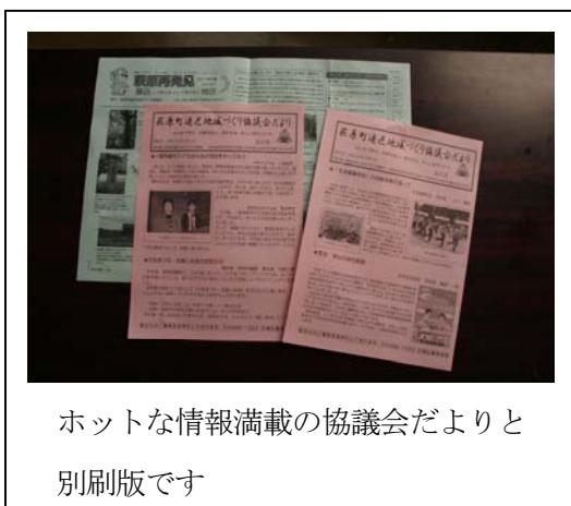
ホットな情報満載の協議会だよりと別刷版です

最後に昨年度は協議会だよりご愛読ありがとうございました。本年度もご協力を宜しくお願いします。