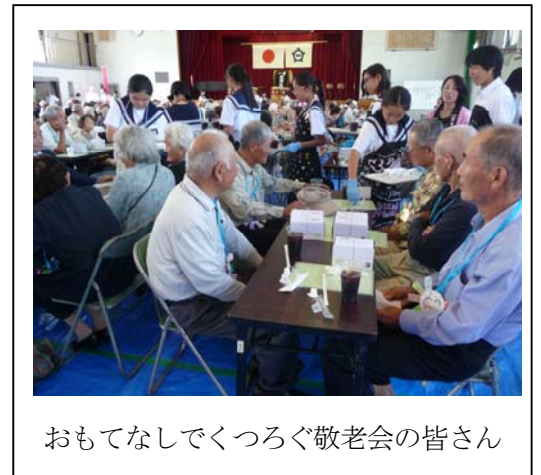
おもてなしでくつろぐ敬老会の皆さん

次回に向けて、より一層楽しい有意義な敬老会の開催を検討しておりますので、皆様のご支援とご協力をお願いしての報告とさせていただきます