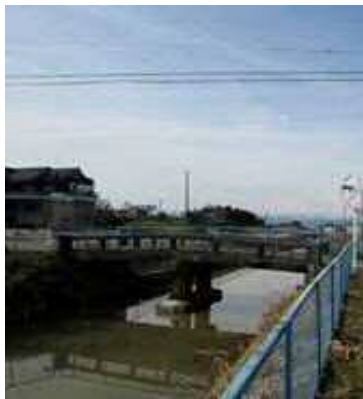
場所：西宮重字東光堂 56 撮影：郷土史研究会(2014)