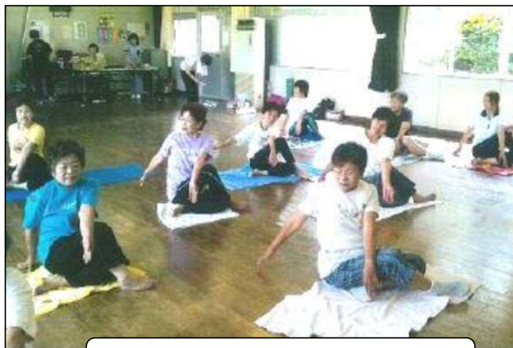
楽しいストレッチヨガ教室