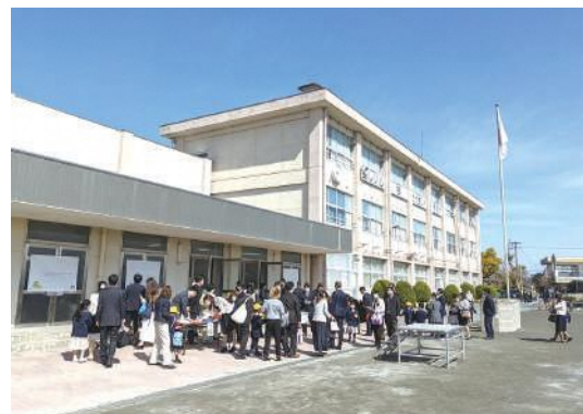
萩原小学校の入学式前の様子