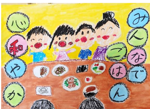
社会福祉協議会長賞