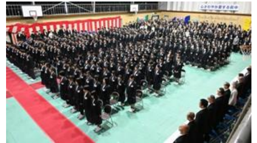
R8.3.6萩原中学校 卒業式